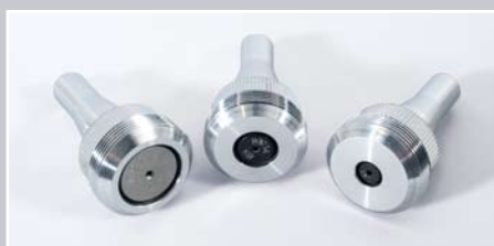
Różne rozmiary narzędzi

Mikroudarowa głowica znakująca przymocowana jest do solidnego stojaka, który zawiera ramę nastawialną na wysokość. Nastawialną wysokość wskazuje licznik. Dokładne nastawienie odległości narzędzia od znakowanego materiału ułatwia kółko ręczne.